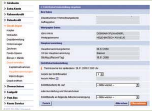
3. Übersicht für die Kartenbestellung.