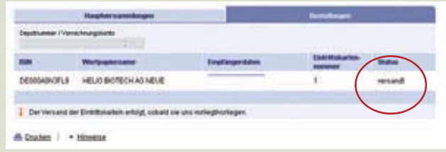
5. ... nach dem Versand der Eintrittskarte.