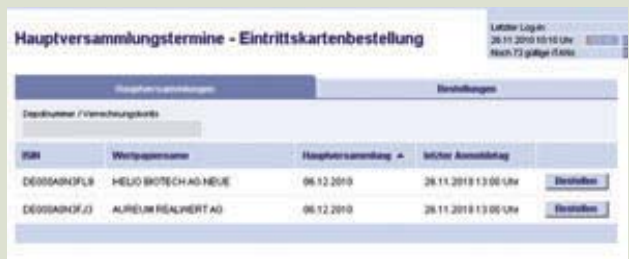
2. Übersicht der aktuellen Hauptversammlungen.