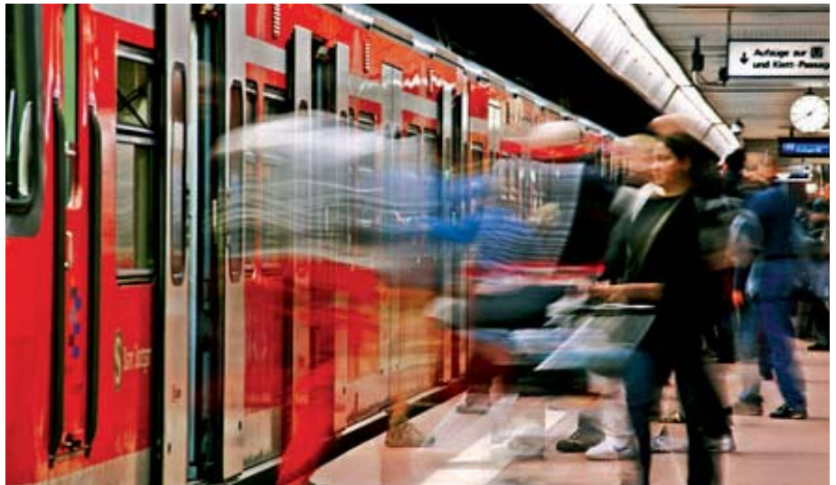
Erfolgreiches Umsteigen erfordert die Zustimmung der Aktionäre.

Die ING-DiBa treibt den elektronischen Workflow bereits einen Schritt weiter: Seit April 2010 können Kunden dort über das Online-Banking auch Eintrittskarten bestellen und Weisungen auf Aktionärsvereinigungen übertragen. „73% nutzen diesen Service bereits. Zählt man die telefonischen Aufträge hinzu, die über denselben Prozess laufen, adiiert sich die Nutzungsquote auf 97%“, rechnet Kress vor. Cortal Consors hat die Umsetzung für 2012 auf dem Fahrplan. Als primären Treiber für die Weiterentwicklungen nennen beide Direktbanken an erster Stelle die eigenen Kunden. Immer mehr legen demnach Wert auf den bequemen Weg ohne Medienbruch, wollen Papier sparen und einen Beitrag zum Umweltschutz leisten. Die Kosteneinsparungen, die Kunden