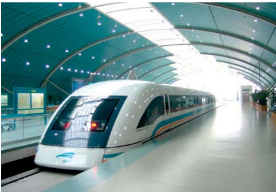
Na dann – gute Nacht! Statt mit Transrapidgeschwindigkeit unterwegs zu sein, kommen die postalischen Einladungen gemütlich und mit vielen Zwischenstopps.

Banken. Er warf ihnen vor, die zwei-jährige Vorlaufzeit vor Inkrafttreten des ARUG verschlafen zu haben. Schon mit dem Referentenentwurf Anfang 2008 hatte der Gesetzgeber die Weichen gestellt und grünes Licht für den ausschließlich elektronischen HV-Versand signalisiert. Als Vorreiter Intershop im März 2010 die Neuregelung erstmals konsequent