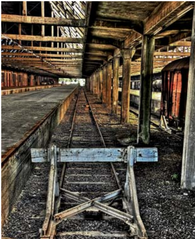
Ohne Zugriff auf Computer und Internet auf dem Abstellgleis? „Alteingesessene“ Aktionäre haben es im Zeitalter des Social Web nicht immer leicht, an die gewünschten Informationen und Einladungen zu kommen.