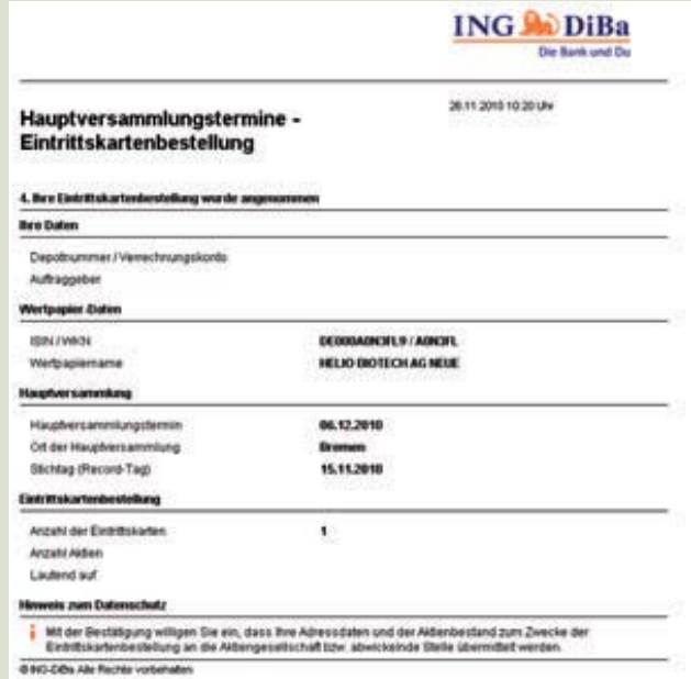
3a. Druck-Protokoll für Kunden