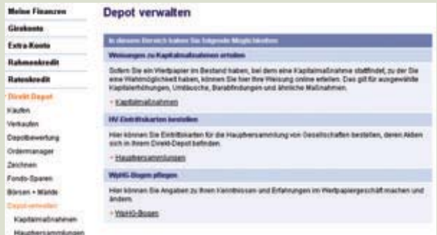
1. Einstieg in „Depot verwalten“ nach dem Login.