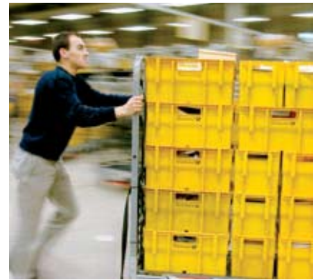
Der postalische Versand der HV-Einladungen führt zu vermeidbaren Portokosten.

von denen in der Regel etwa 30 auf der Hauptversammlung erscheinen. Die Gesellschaft hat sich laut Satzung künftig auf ausschließlich elektronischen Versand an die Banken festgelegt. Nicht alle Gesellschaften gehen so weit. Ein Großteil hält sich den elektronischen Versand gemäß Vorstandermächtigung offen.