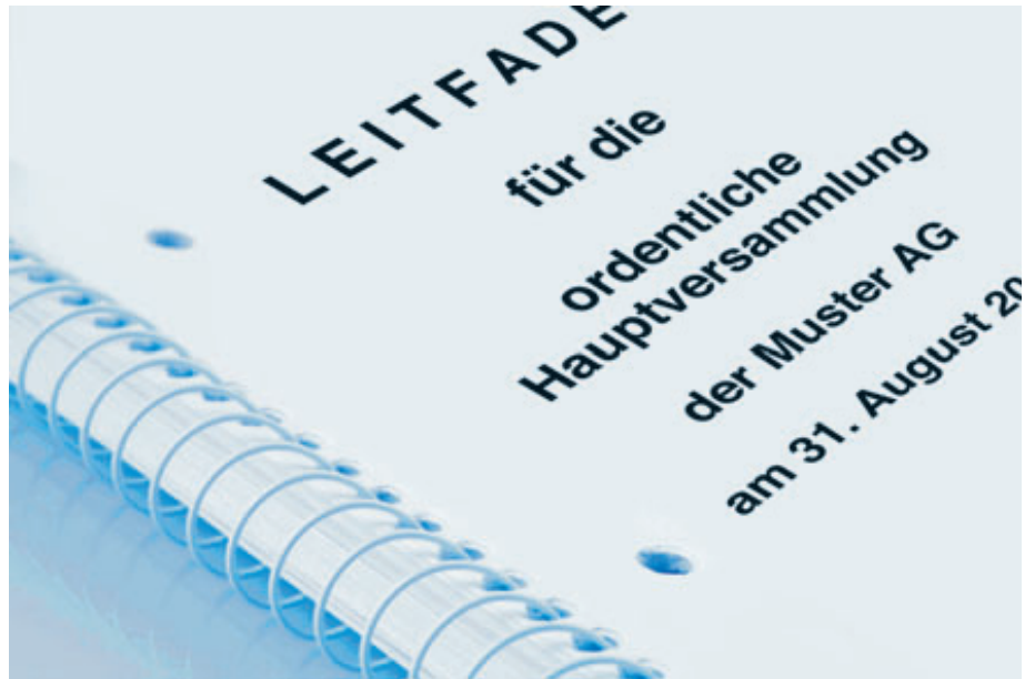
Am weitesten verbreitet sind nach wie vor papiergebundene Leitfäden.

Mit dem Leitfaden können Gesellschaften keinen Schönheitswettbewerb für ein besonders schickes oder CI-konformes Layout gewinnen. Müssen sie auch nicht. Wichtig ist, dass sich der Versammlungsleiter leicht darin zurechtfindet. Man sollte ihm überlassen, ob er als Instrumentarium ein Ringbuch, eine Loseblattsammlung, ein gebundenes Heft oder eine digitale Variante vorzieht. Am weitesten verbreitet sind nach wie vor papiergebundene Leitfäden. Darin dienen zur einfachen Orientierung zum Beispiel Marginalien mit den wichtigsten Stichworten sowie inhaltlich sinnvolle Absätze. Gut vorbereitete Versammlungsleiter haben ihren Leitfaden zusätzlich mit Merkern verse-