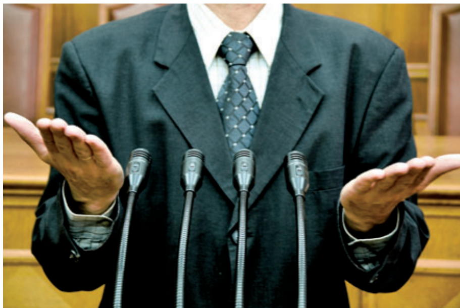
Durch den Einsatz eines elektronisch gestützten Leitfadens über einen Teleprompter kann ein erfahrener Versammlungsleiter den Eindruck freier Rede vermitteln.