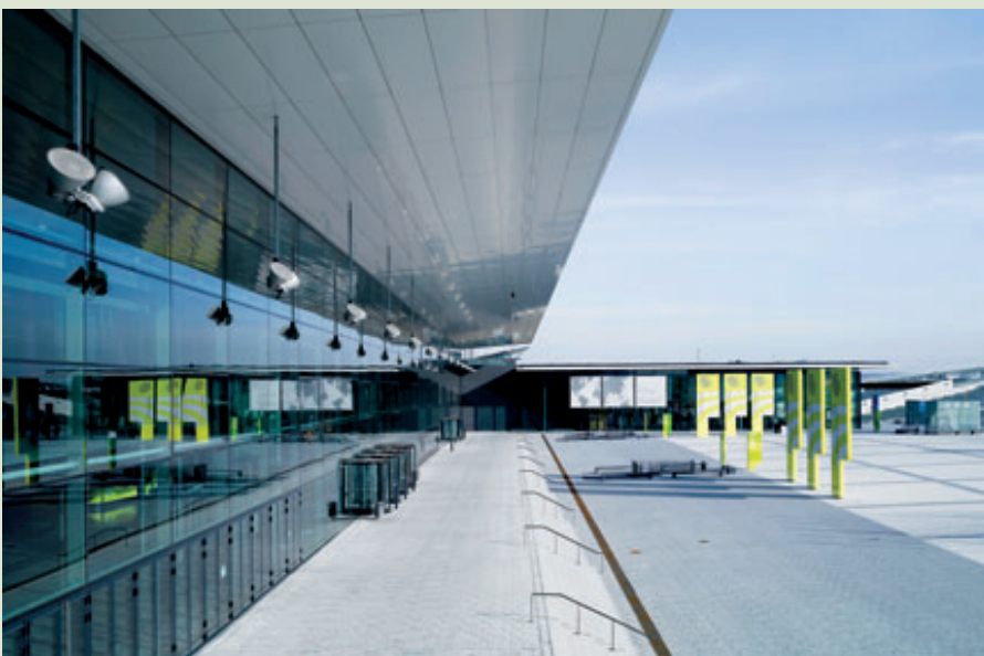
Das ICS ist durch die Anbindung an die Messe Stuttgart beim Raumangebot sehr flexibel.