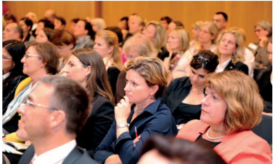
Teilnehmer des FidAR-Forums in der Britischen Botschaft in Berlin