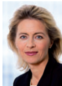
Ursula von der Leyen

Das gleiche Ziel vor Augen, wollen jedoch nicht alle dem norwegischen Beispiel folgen. Die Veranstaltung der Initiative Frauen in die Aufsichtsräte (FidAR) machte deutlich, dass es dazu unterschiedliche Wege gibt. So kündigte Bundesministerin Ursula von