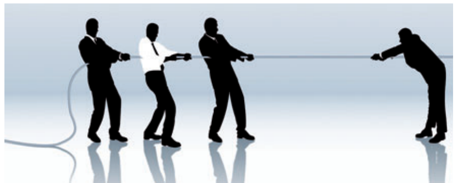
Heute haben Aktivisten so viel Macht wie nie zuvor – auch wenn es den Unternehmen schwer fällt, das zu akzeptieren.

Ein weiteres Phänomen, das Höreth auf den Punkt bringt: „Die HV ist zum Tummelplatz wirtschaftsferner Themen geworden.“ Nirgendwo dürfte sich dies in diesem Jahr augenscheinlicher gezeigt haben als bei Nestlé.