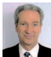
Prof. Michael Jensen